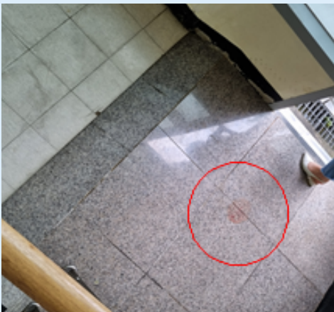
사고발생 장소(재해자 혈흔)