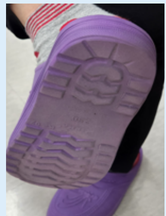
사고 시 착용 신발